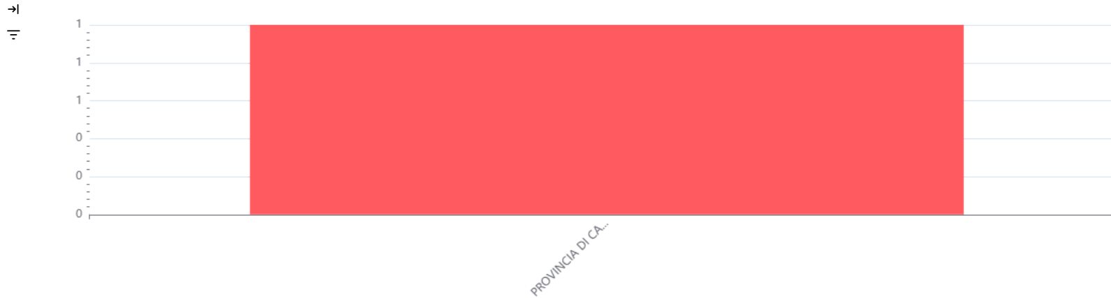
Prime stazioni appaltanti per valore